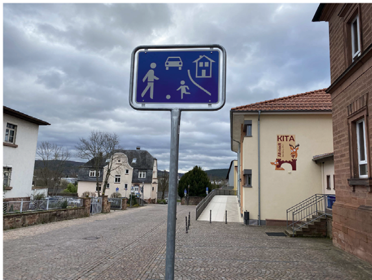
Verkehrsberuhigter Bereich KiTa Altstadt

Fachbereichsleiter Bauwesen & Stadtentwicklung